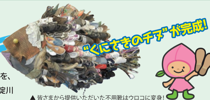
▲皆さまから提供いただいた不要靴はウロコに変身! 全て“ごみ”で作られたアート作品です!