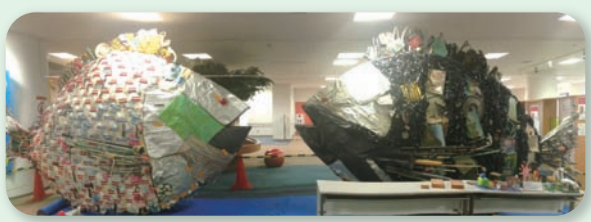
▲昨年12月まで啓発施設に展示していた淀川テクニクのアート作品「オンチヌ」「メンチヌ」(クロダイがモチーフ)