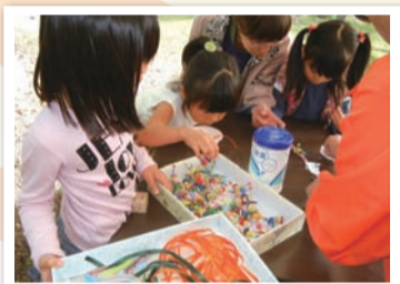
▲楽しく学ぶワークショップ