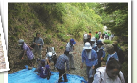
▲みんなで守る!里山林整備活動