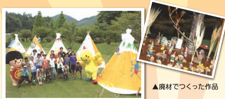
▲廃材を利用してつくったティピーテント!

【発行・編集】 猪名川上流広域ごみ処理施設組合 〒666-0103 兵庫県川西市国崎字小路13番地 http://www.kunisakicc.jp/association/ 電話 072-744-7280(直通) 072-744-7281(FAX) メール ina-kouiki@asahi-net.email.ne.jp