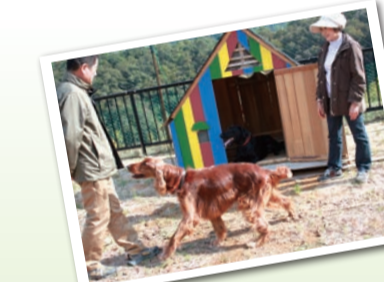
▲愛犬とのびのび 過ごすドッグラン♪