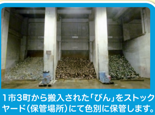
1市3町から搬入された「びん」をストックヤード(保管場所)にて色別に保管します。

【発行・編集】猪名川上流広域ごみ処理施設組合 〒666-0103 兵庫県川西市国崎字小路13番地 http://www.kunisakicc.jp/association/ 電話 072-744-7280(直通) 072-744-7281(FAX) メール ina-kouiki@asahi-net.email.ne.jp