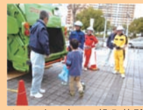
▲パッカー車への投入体験

【お申込み・問合せ】川西市 美化環境部美化環境室美化推進課(ごみ減量業務) TEL 072-759-4240(直通) / TEL 072-759-8011 〒666-0011 川西市出在家町1-11