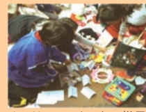
▲フリーマーケットの様子

◎出店者の応募方法等に関する詳細につきましては、学校で配布されるチラシをご覧ください。