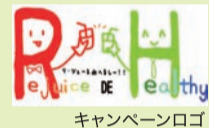
キャンペーンロゴ

ホームページで紹介している「リ・ジュース deへるし〜」にレシピを追加しました。ぜひ一度ご覧いただき、お試しください。また、ご意見、ご感想などありましたら、当係までお送りください。