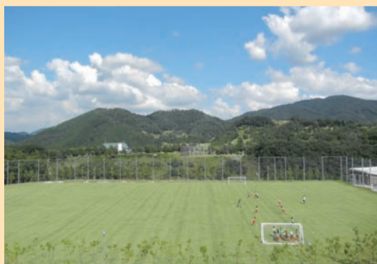
国崎クリーンセンターゆめほたるホームページ http://www.kunisakicc.jp/

利用の申込など詳細については、啓発施設「ゆめほたる」のホームページをご参照いただくか、お電話にてお問い合わせください。