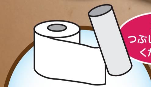
トイレトペーパーの芯、ティッシュの紙箱