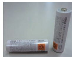
▲充電式電池(リチウムイオン、ニカド、ニッケル水素)