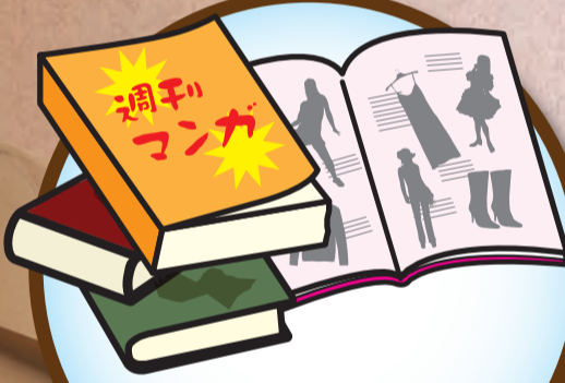
本、雑誌、パンフレット類