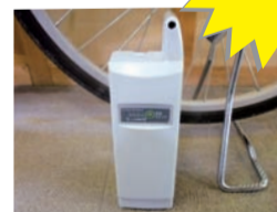
▲電動自転車のバッテリー