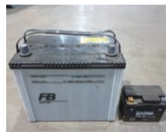
▲自動車、単車のバッテリー