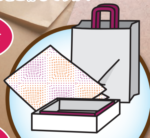
包装紙、菓子箱、紙袋