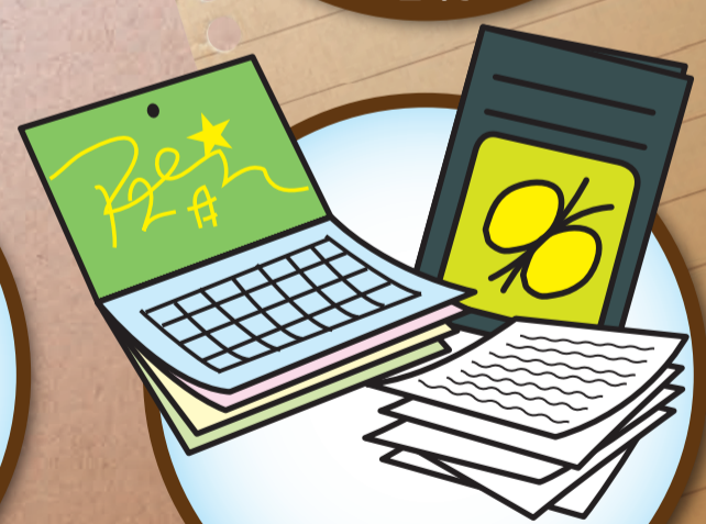
ノート、カレンダー、コピー紙