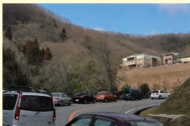
▲ 渋滞する施設までの道路

例年、8月15日前後のお盆の時期は、多くの方がごみを持ち込まれるため、大変混雑しご不便をお掛けしております。今年も、施設への入場から退場までに2時間以上の時間がかかることが予想されます。ごみの持ち込みを予定されている皆さまには、この時期を避けていただきますよう、ご協力をお願いします。