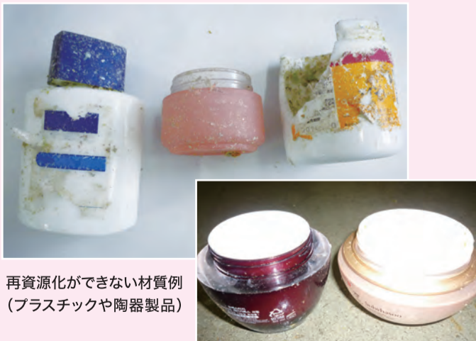
再資源化ができない材質例(プラスチックや陶器製品)

ビンごみの適正な分別にご協力ください! ビンごみとして当施設に搬入されてくるビンの中には、材質がプラスチックや陶磁器でできている、ビンとは異なるごみが混入されることがあります。 搬入されたビンごみは、再資源化を行っており、工場に運ばれて新しいビン等に生まれ変わります。 ビン以外のごみが混入すると、再資源化ができない物となりますので、ごみとして出される場合は必ずビンであることを確認いただき、適正な分別をお願いいたします。 ビンの代表的なもの(無色・茶色・その他の色) ■ 飲料ビン ■ 食品・調味料・食品用油のビン ■ 経口薬品のビン ■ 化粧品品のビン