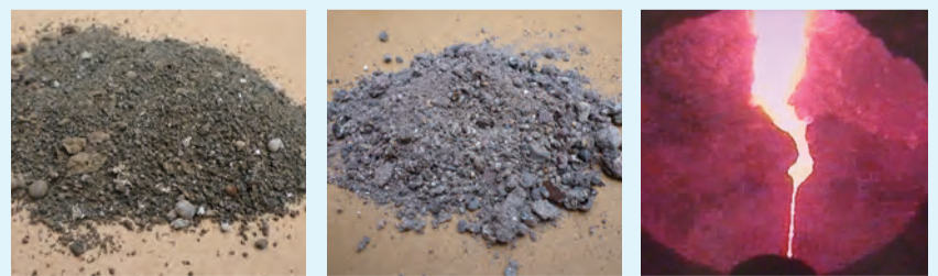
写真3 / 溶融メタル

ごみを燃やして出てくる焼却灰には、溶融に適さない異物(カン、電池、金属くずや陶器等)が含まれています。これらをふるいと磁選機とで取り除いた後に、約1400度の高温で溶かします。(写真1) 溶けた灰は、水を張った水槽に流れ落ち、急激に冷やされガラス状になります。これを破碎してできた粒が溶融スラグです。(写真2) 溶融スラグには、メタル分が含まれていて、磁選機とアルミ選別機で取り出したものが溶融メタルです。(写真3) 見た目は似ていますが、溶融スラグは、路盤材として再利用され、道路舗装などに活用されています。また、溶融メタルは、金や銀などの金属を多く含む資源として、有効利用されます。