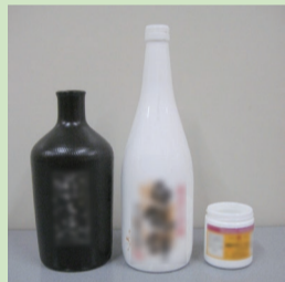
陶磁器・リサイクルできないびん

「乳白色・白色のびん」「びんの形をした陶磁器のボトル」は、ガラスびんと一緒にリサイクルできませんので、不燃ごみとして出してください。「割れたびん」も危険なので、不燃ごみとして出してください。ビールびんや一升びんなどのリターナブルびんは、できるだけ購入店へ返してください。