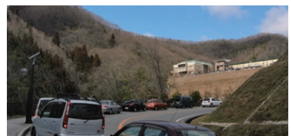
▲混雑による渋滞の様子

あらかじめご了承ください。ごみの持ち込みを予定されている皆さまには、この時期を避けたいご予約や、お住まいの市町の収集をご利用いただきますよう、ご協力をお願いします。