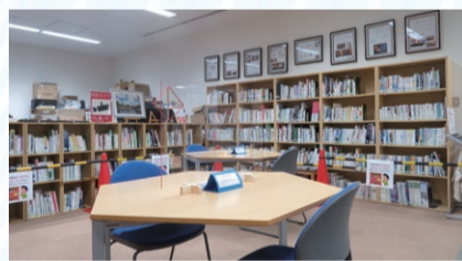
書籍コーナー&交流スペース