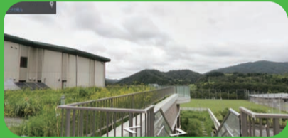
周辺の里山の景観を楽しもう!!