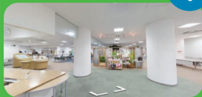
リサイクルやごみ問題を楽しみながら学習できる展示物があります。