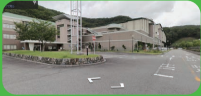
ゆめほたる南東から見た建屋外観です。