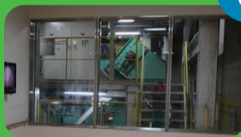
ごみを燃やしてできた灰を高温で溶かしてスラグやメタルとして再資源化することにより、最終処分場での埋立量を減らしています。