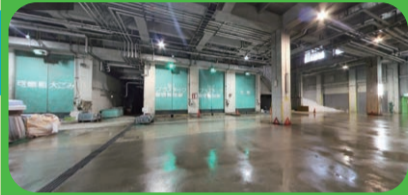
可燃ごみ以外の粗大ごみや資源物が入ってくる場所です。