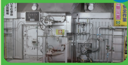
2炉で1日に何トンのごみを燃やせるかな? 答えはバーチャル施設見学で確認できます。