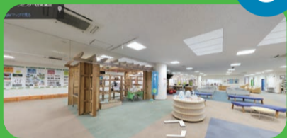
スタート地点から一周してゆめほたる受付の奥側に戻ってきました。