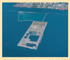
神戸沖埋め立て処分場

最終処分場では、尼崎基地等から船で運ばれてきた焼却灰等を埋め立てています。 ※陶磁器類以外は、焼却施設から出た残さ物です。