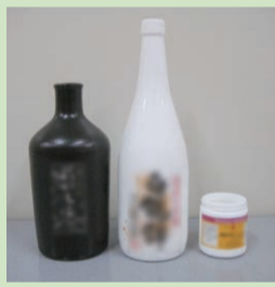
陶磁器・リサイクルできないびん

ビールびんや一升びんなどの「リターナブルびん」はリサイクルするため、購入店へ返してください。