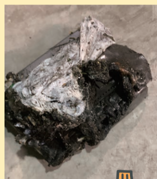
焼けたリチウムイオン電池

家庭ごみとして廃棄せず、電気店等の回収箱を利用されるなど、お住まいの市町の分別方法に従い、適切な分別へのご協力を願います。