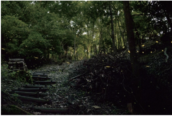
当施設敷地内に生息するヒメボタル

6月下旬にヒメボタルの調査を実施しましたが、ごみ処理施設稼働による影響は確認できませんでした。