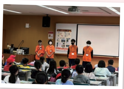
小学生の社会見学