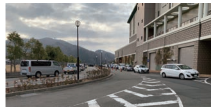
年末に混雑している様子