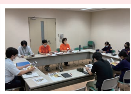
啓発イベント会議