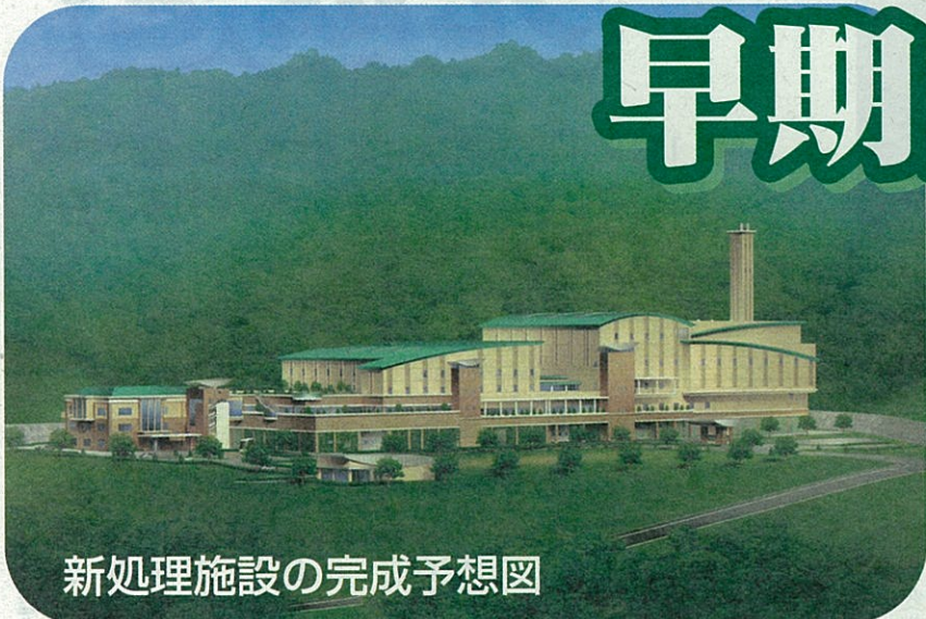
新処理施設の完成予想図