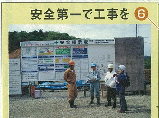
安全第一で工事を⑥