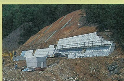
② 北側堰堤(えんてい)付近