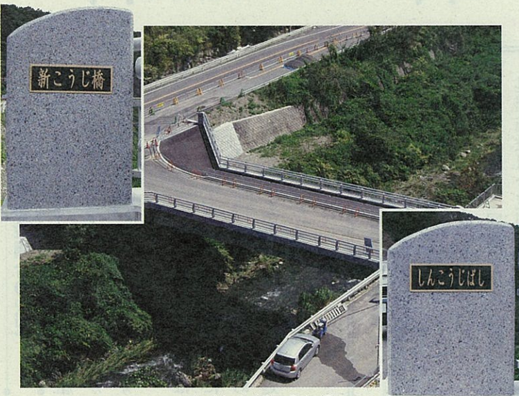
完成した新こうじ橋

平成18年6月30日開催の猪名川上流広域ごみ処理施設組合名称選考委員会において、応募名称の中からみだしの名称に決定いたしました。