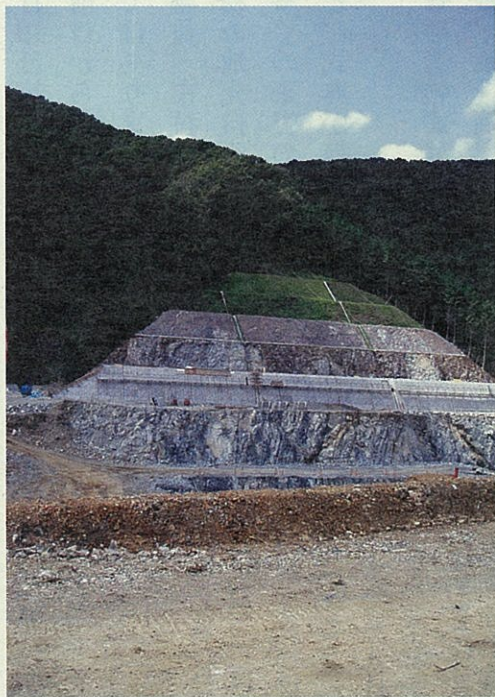
吹付けした種子が生育している法面

昔から人間の伐採等の営みにより二次的にできた台場クヌギが造成区域に1本あり、造成工事に影響がないことから現状のまま保存していきます。