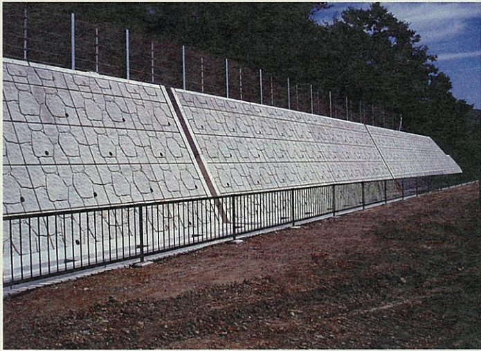
完成した北側の大型ブロック積み

現在、建物敷地の大型ブロック積擁壁、法面の種子吹付け、排水工を順次施工しており、11月末に造成工事完了を予定しています。