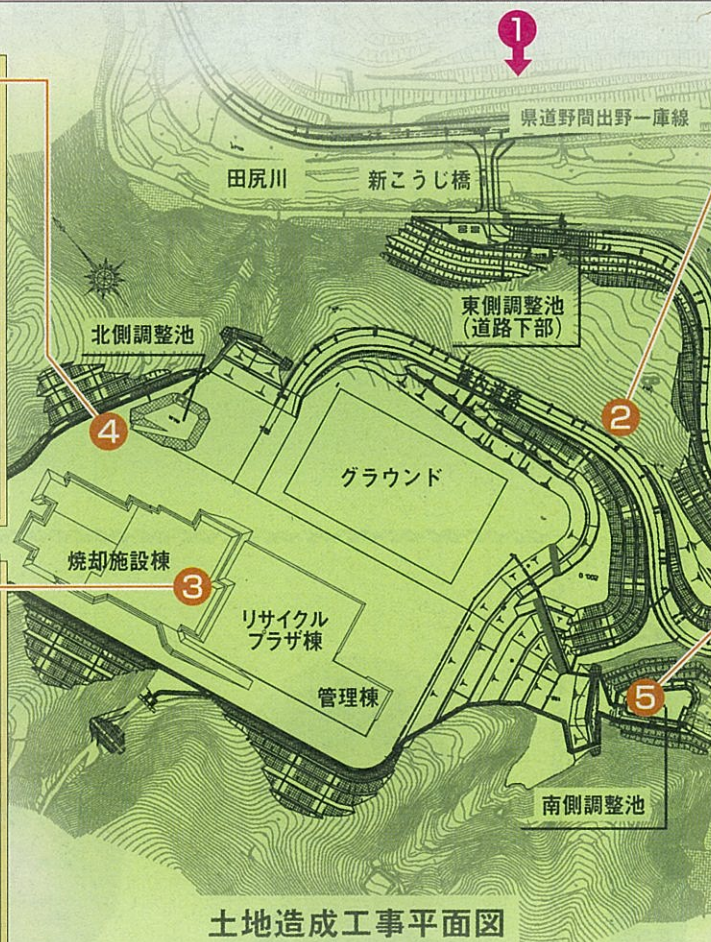
土地造成工事平面図