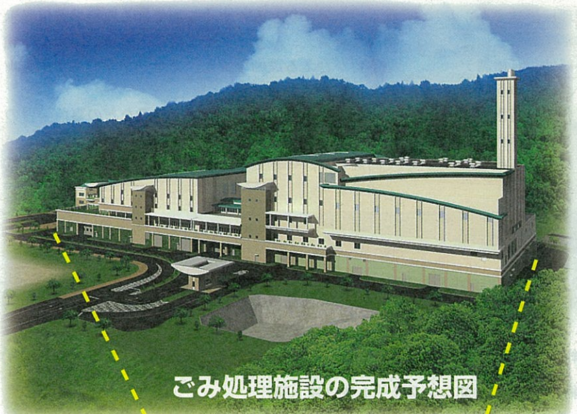
ごみ処理施設の完成予想図

ごみ処理施設の概要を2面と3面に掲載しています。現在の状況や概要を参考に、施設の名称を考えてください。