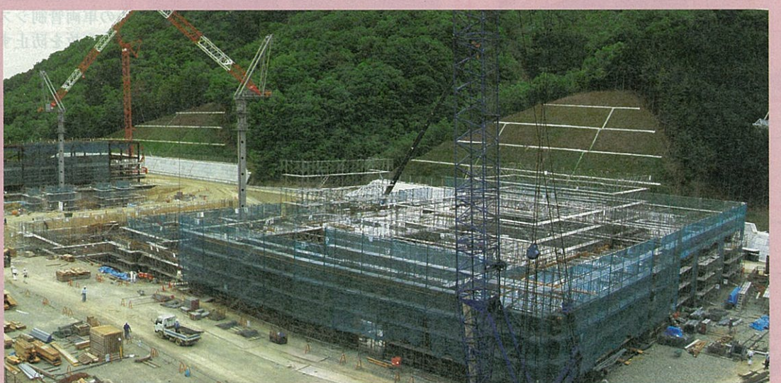
建設工事の状況(平成19年5月)