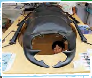
くにさき なつのごんちゅうかん

共催 兵庫県立 人と自然の博物館 日程 7月31日(日)~8月7日(日) ※8月1日(月)休館日 時間 10:00 ~ 16:00 参加費 無料