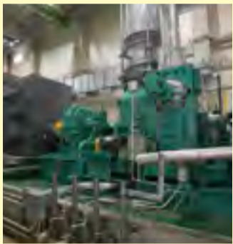
▲蒸気タービンと発電機

国崎クリーンセンターでは、設備の運転を電気使用ピーク時間を避けるなどして、施設内の節電に努めるとともに、ごみ焼却炉の運転を工夫することで、施設に設置している高効率の発電施設(写真)の発電量を高水準に安定させ、関西電力からの電力供給を当初計画より14日間減らします。これらの対策により、ピーク時の電力を30%以上節電することができました。