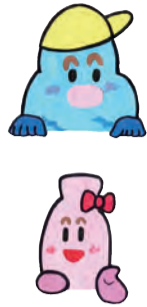
市オリジナルごみ減量キャラクター

川西市では、まちづくり出前講座「子ども向け学習会」を実施しています。 川西市内の幼稚園・保育所、子育てグループなどの団体からの依頼に応じ、職員が地域に出向いて開催します。市オリジナルごみ減量キャラクターが登場する紙芝居やダンスのほか、子ども達が実際にごみの分別にチャレンジしたり、パッカー車のごみを収集する様子を見学したり、楽しく学べるプログラムを用意しています。 まずは、リサイクル推進課へお電話などで日程を予約してください。