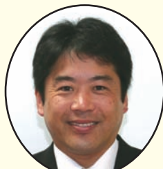
宮東 豊一 副議長